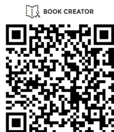
Los Viajeros del tiempo de Vía Garibaldi - T.A.L.E Book Creator Colegio Córdoba